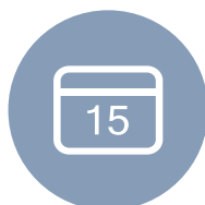
SERVIZIO DI PIANIFICAZIONE VISITE