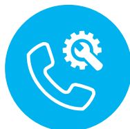
REPERIBILITÀ ED ASSISTENZA