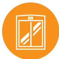
INSTALLAZIONE NUOVI IMPIANTI