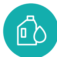
RIPRISTINO LIVELLO OLIO