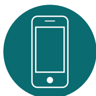
GESTIONE INFORMATIZZATA DEGLI INTERVENTI