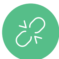
CONTROLLO MAGNETOINDUTTIVO DELLE FUNI DI TRAZIONE