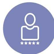
PERSONALE COSTANTEMENTE AGGIORNATO