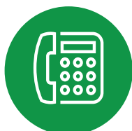
SERVIZIO DI COMUNICAZIONE IN CABINA