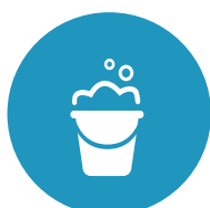
IGIENIZZAZIONE ECOLOGICA DELLA FOSSA