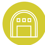
MAGAZZINO RICAMBI MULTIMARCA