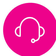
ASSISTENZA COMMERCIALE ED AMMINISTRATIVA